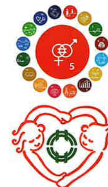
男女共同参画宣言都市シンボルマーク

家庭・職場・地域それぞれで何ができるのか、話し合ってみませんか。新居浜市男女参画・市民相談課では、男女共同参画社会の実現に向け様々な取り組みを行っています。HPもぜひご覧ください!